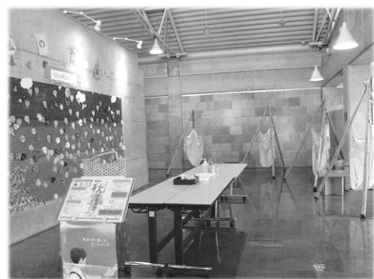
私の主張 ～〇〇がしたい！～