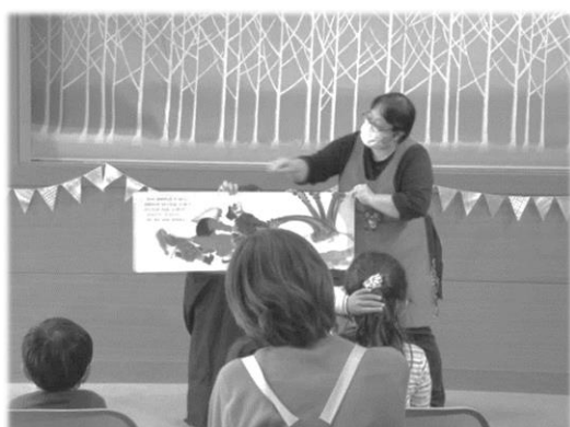
おはなしハンパティのおはなし会スペシャル