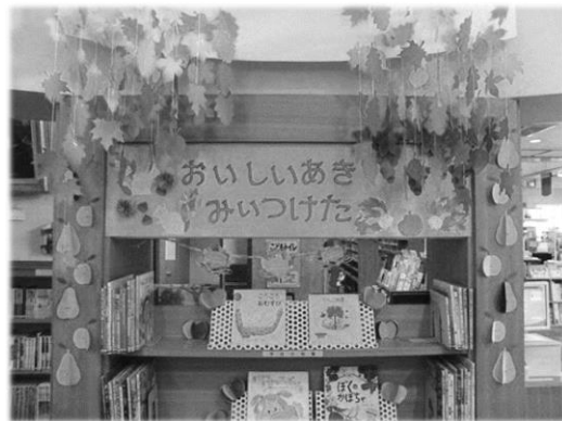
児童特設 「おいしい あき みつけた」