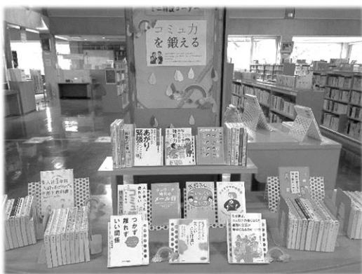
一般ミニ特設 「コミュカを鍛える」