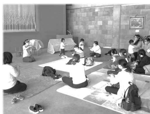
にじいろスマイルのおはなし会