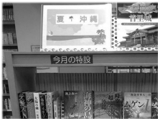
西部特設展示 「夏 沖縄」