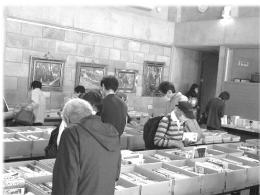
ブックリサイクル