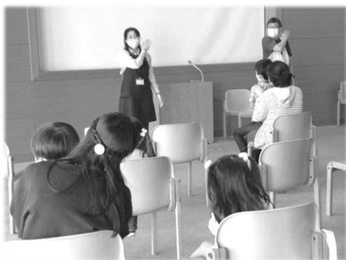
図書館員によるおはなしタイム