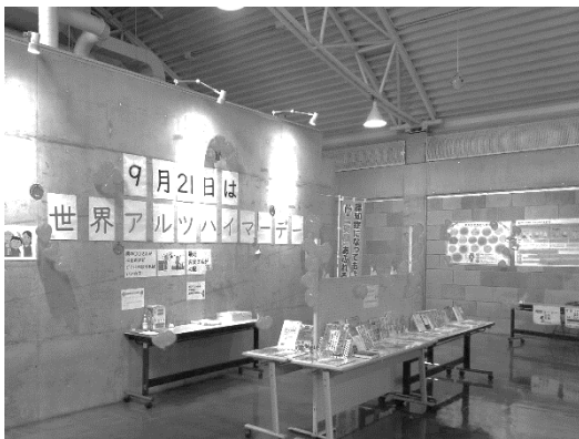
第2回オレンジフェスタinかんだ