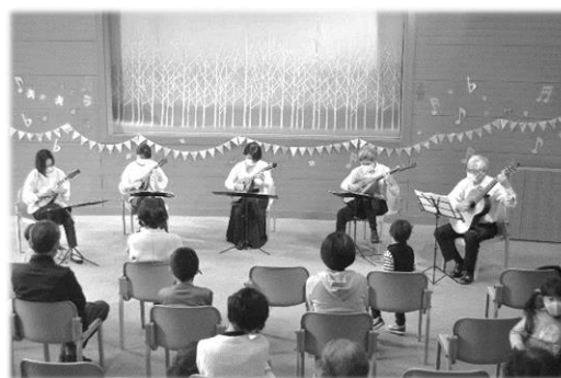
キャッキエラマンドリンアンサンブル ミニミニコンサート