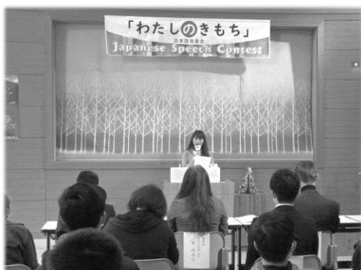
「わたしのきもち」日本語発表会