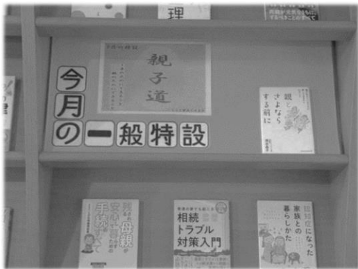
一般特設 「親子道～子のためにできること、親のためにできること」